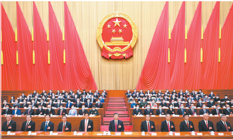
习近平等党和国家领导人在主席台就座。