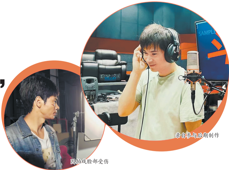
亲自参与后期制作