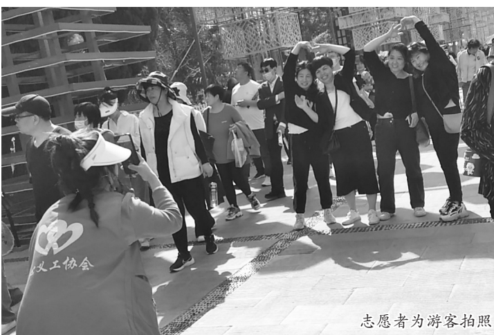
志愿者为游客拍照

志愿者们在园区内发放文明旅游宣传资料,宣传普及文明旅游知识,传播文明旅游理念,开展文明劝导、文明指引、环境维护、秩序维护、应急救援等志愿服务,积极倡导市民遵守法规、恪守公德、讲究礼仪、爱护环境,并在游客聚集场所帮助疏导秩序、劝阻随地乱吐口香糖、乱扔垃圾、推搡争执等,通过开展现场文明宣