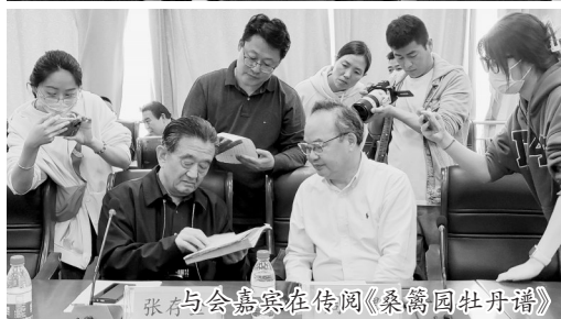
与会嘉宾在传阅《桑篱园牡丹谱》