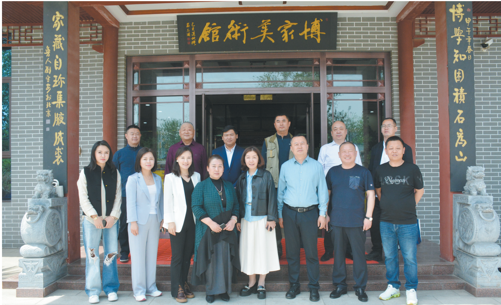
书画家在博家美术馆合影留念