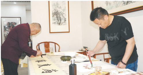
挥毫泼墨,精心创作