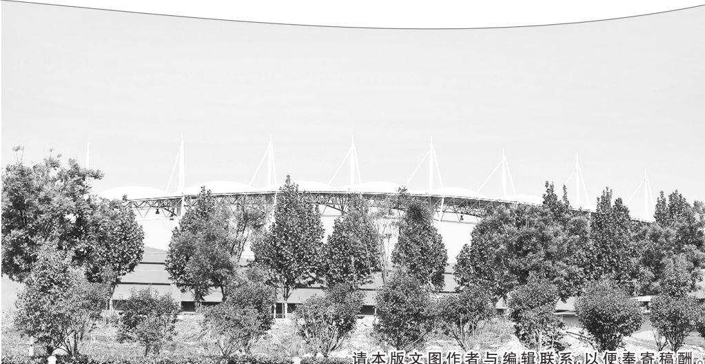
请本版文图作者与编辑联系,以便奉寄稿酬。

换岗或轮岗,很多人都会遇过。人始终是向前走的,任何事情必须向前看。不妨换个心态或者角度去看待变动:主动换岗是自己创造的机遇,被动换岗是组织给的机遇,跨界换岗是难得的人生大机遇,年龄变化是常态化机遇。不管出于什么原因,只要正面地看,做事就不会偏;扎实地做,结果就不会差;大胆地闯,就抓住了每一次变好的跳板,让自己一次比一次飞得更高,过得更好。