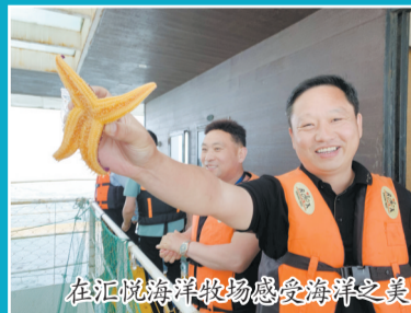
在汇悦海洋牧场感受海洋之美