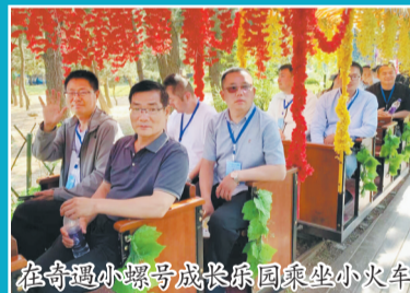
在奇遇小螺号成长乐园乘坐小火车