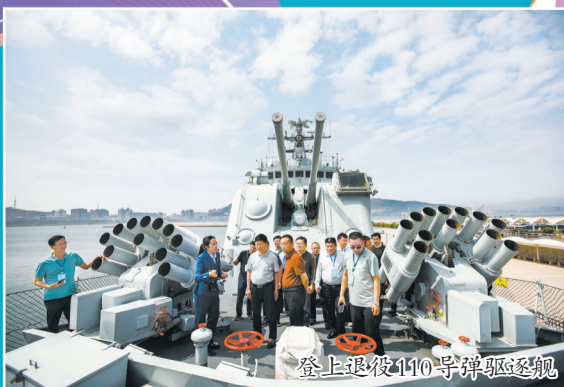
登上退役110号导弹驱逐舰