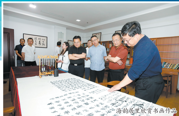
海韵居里欣赏书画作品

站在火炬八街的坡顶,向北望去,喧闹干净的街道尽头是海天相接……5月18日,采风成员们来到网红打卡地火炬八街,身临其中,感受独特的浪漫气息。