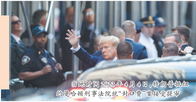
当地时间2023年4月4日,特朗普抵纽约曼哈顿刑事法院就“封口费”案接受提审

美国共和党籍前任总统唐纳德·特朗普当地时间8月1日被指控试图推翻2020年总统选举结果。这是他今年第三次受到刑事罪名指控。共和党人和民主党人选边列队,相互攻击。