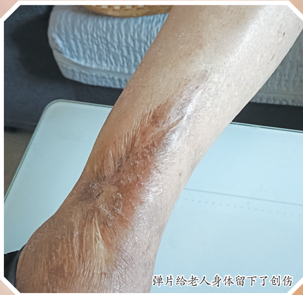
弹片给老人身体留下了创伤