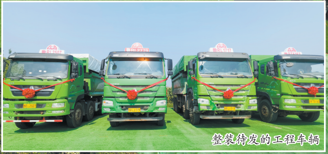
整装待发的工程车辆