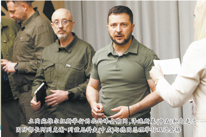
立陶宛维尔纽斯举行的北约峰会期间,泽连斯基(中右)和乌克兰国防部长阿列克谢·列兹尼科夫(中左)与德国总理举行双边会晤

这是乌克兰危机去年2月升级以来乌克兰国防系统最重大人事调整。列兹尼科夫领导的国防部深陷腐败丑闻,他本人则坚决否认有过错。