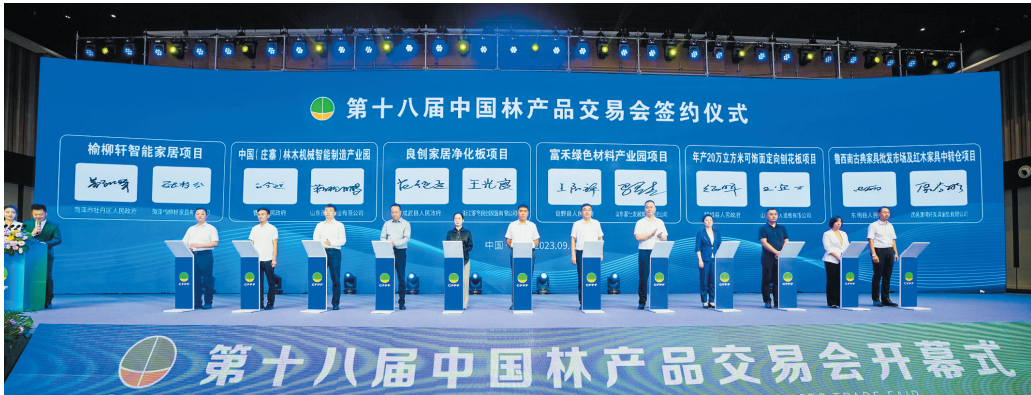
第十八届中国林产品交易会举行项目签约仪式。

产业生态化的路子,通过市场引领、政策引导、创新驱动、社会参与,积极推动绿水青山转化为金山银山。下一步,将充分利用和发挥中国林产品交易会的平台作用,大力发展特色产业,提高林业生产水平和综合效益,加快推进由林业产业大省向林业产业强省转变。