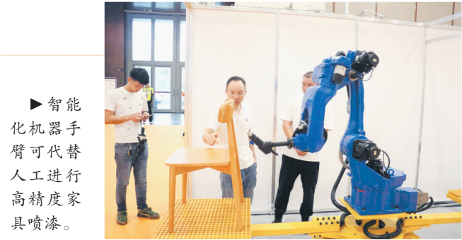
智能化机器人手臂可代替人工进行高精度家具喷漆。

陆铜华表示,本届林交会既是全国林业产业发展成果的一次展示,也是为推动林业产业发展提供的一个交易平台、信息平台。菏泽市林业起步早、基础好,是全国重要的林产品生产加工基地之一,相信菏泽林业产业将会迎来更加美好的未来。