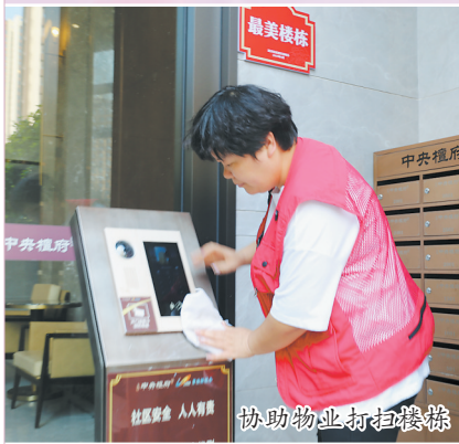
协助物业打扫楼栋