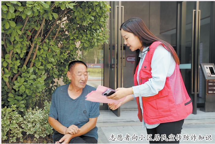
志愿者向小区居民宣传防诈知识

志愿者们通过各类服务提升了楼道整体环境，营造了“恭友睦邻”的和谐氛围，充分挖掘了居民的自治能力，提高了居民参与志愿服务、助力文明创建的积极性。“有事就找志愿者”，如今，在耿庄社区已成为当地居民的“口头禅”。