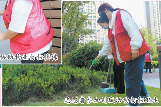
志愿者参加创城活动打扫卫生