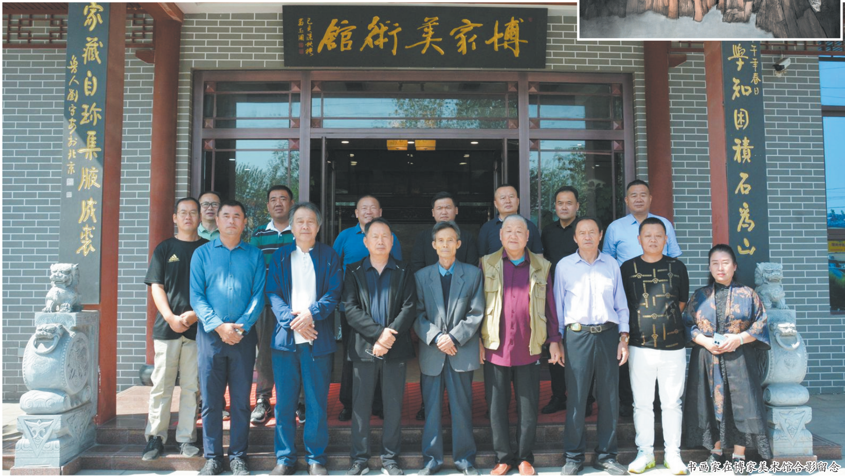
书画家在博家美术馆合影留念