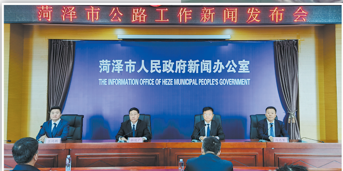
▲新闻发布会现场。 ►濮新高速菏泽段建成通车。