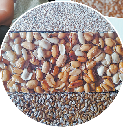
←糖仁片 色泽金黄、果 仁丰富