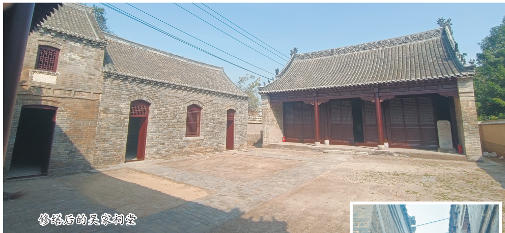
修缮后的吴家祠堂