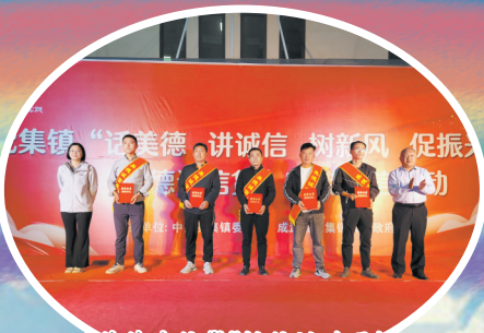
“美德诚信贷”授信活动现场