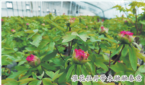
催花牡丹带来融融春意

本报讯(牡丹晚报全媒体记者 姜培军) 2024年春节的脚步越来越近,作为年宵花“当家花旦”的催花牡丹正在热销。2月1日,记者从菏泽部分催花牡丹基地获悉,截至目前,菏泽七成催花牡丹已经售出。