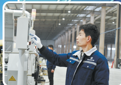
万华一期生产车间

式服务，帮助企业办理注册、环评、能评、安评等相关手续，有效保障了项目顺利开工建设。