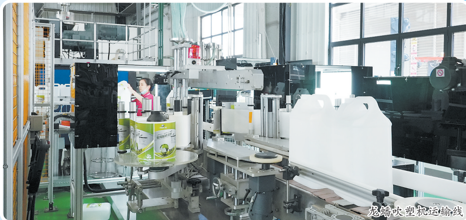
龙蟠吹塑机运输线

在项目洽谈期间，鄄城县专门组建了龙蟠科技招商专班，精心制定招商方案。在项目签约落地后，成立了龙蟠科技服务专班，县级领导牵头包保驻点，有关责任单位全力靠上，为企业提供全流程、保姆