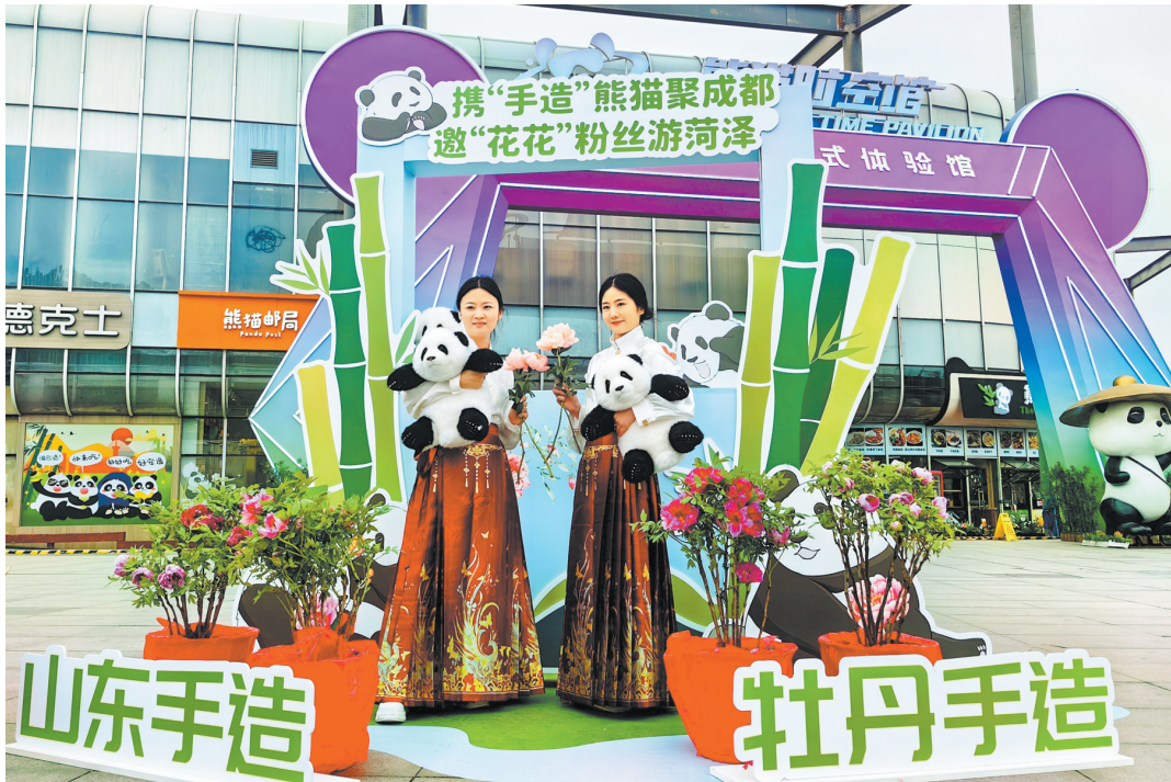
上图:工作人员展示菏泽牡丹和熊猫玩偶。左上图:菏泽特色手造亮相成都熊猫广场。

关工作人员还向成都大熊猫繁育研究基地捐赠了熊猫玩偶“和花”“和叶”以及牡丹园门票,向成都市民赠送了牡丹芍药鲜切花、牡丹文创产品、牡丹园门票等礼品,诚挚欢迎四川人民来菏泽欣赏国色牡丹、参观熊猫工厂。