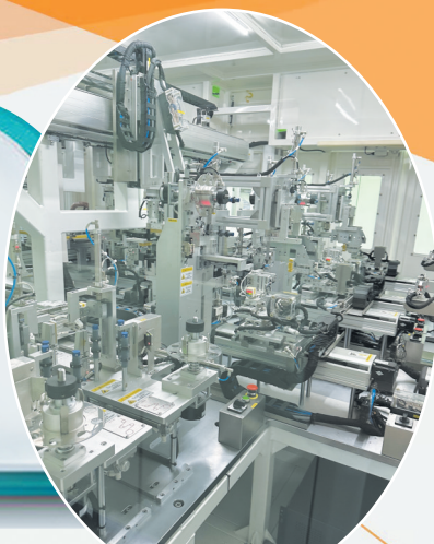
烁燊新能源科技生产车间一角

招商引资是地方经济发展的加速器,是产业转型升级的重要抓手,也是城市发展的后劲所在。2024年是单县重点产业五年攻坚突破行动“三年见成效”之年。单县紧抓招商引资这个重要引擎,围绕五大主导产业和一批新兴及提升改造产业,以重点产业兴旺推动全县全面振兴、后来居上。