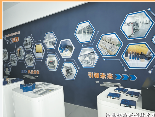
烁燊新能源科技文化墙