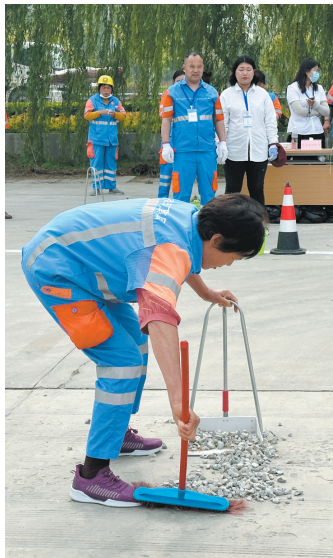
环卫技能比赛现场

本报讯(牡丹晚报全媒体记者 马敏静) 4月28日下午,由市城管局主办、菏泽京环环境服务有限公司承办的“五一”环卫技能暨趣味比赛举行,70余名环卫工人赛场竞技。比赛旨在检阅环卫工人技能水平,展示我市环卫行业风采。