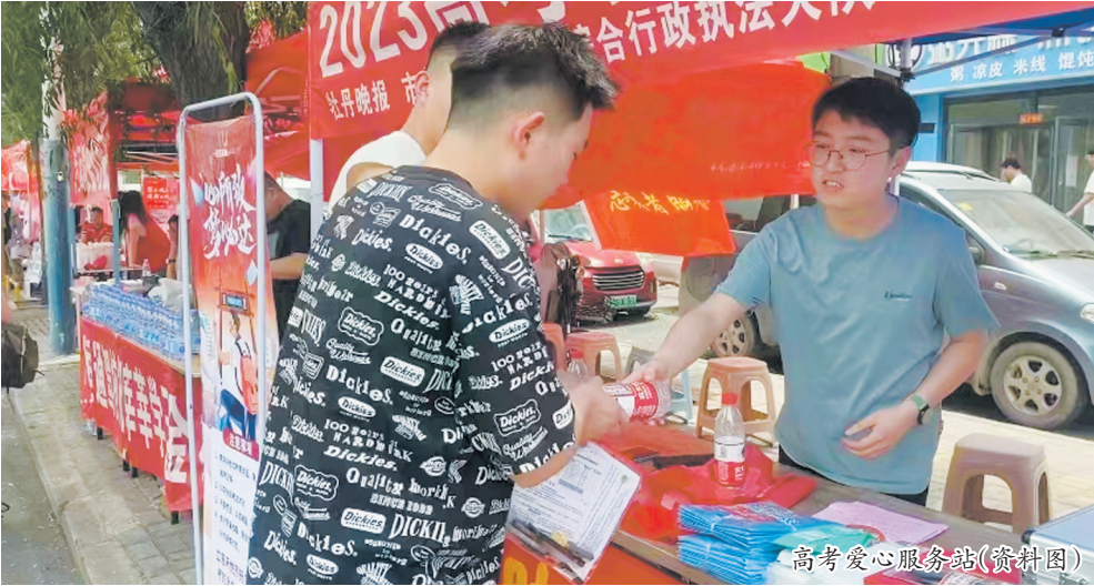
高考爱心服务站(资料图)

“我们继续报名参加牡丹晚报‘爱心助考’活动。”连日来,牡丹晚报全媒体记者接到多位爱心市民和商家打来的电话,他们纷纷表示,愿意在高考期间贡献自己的力量,这其中,有很多都是牡丹晚报的“老面孔”。