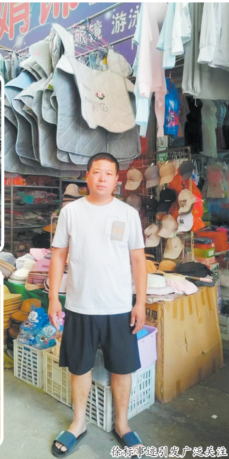
徐标事迹引发广泛关注