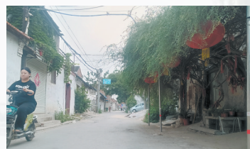
衙门前街及其生长500年的枸杞树