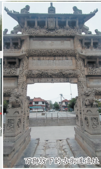
百狮坊下的古街道遗址

故城,不仅指代具体的地理位置,还承载着丰富的历史信息和文化价值。在历代文献,在馆藏展陈,在人们心灵深处,单县故城依然存在,成为抹不去的乡愁和对传统文化的眷顾……