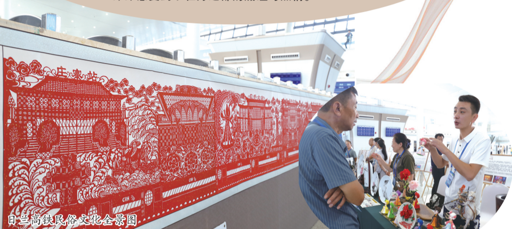
日兰高铁民俗文化全景图