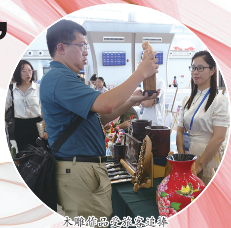
木雕作品受旅客追捧