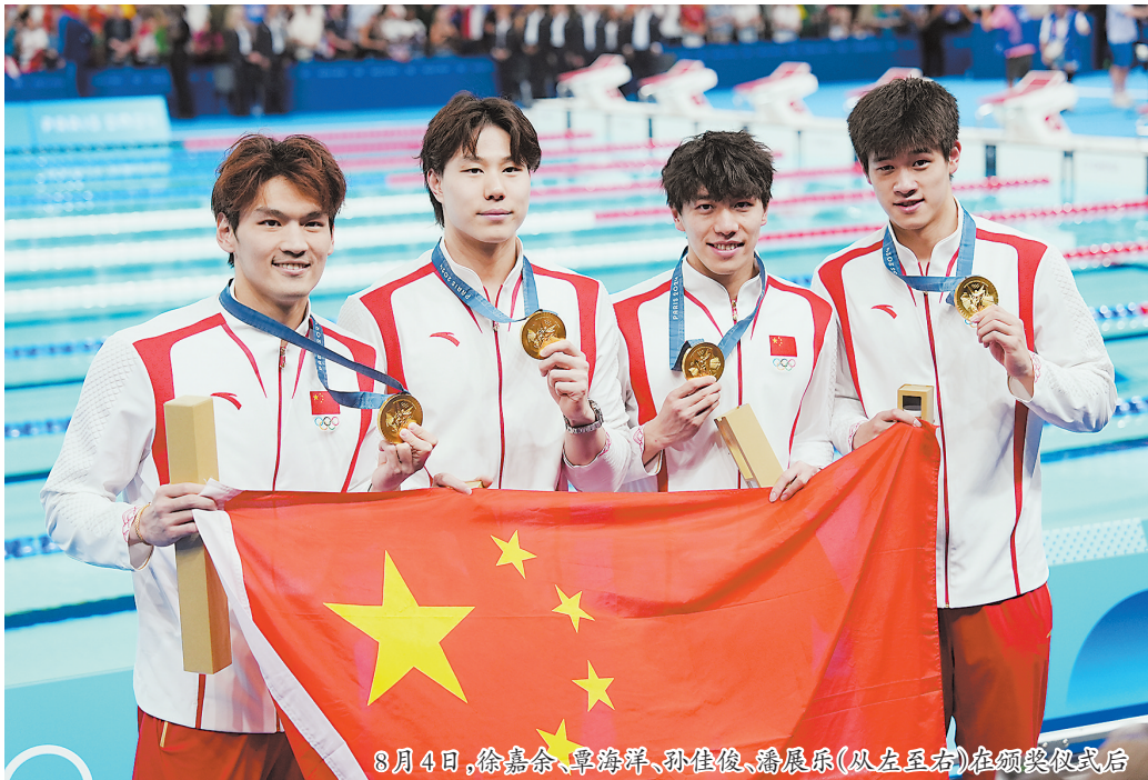
8月4日,徐嘉余、覃海洋、孙佳俊、潘展乐(从左至右)在颁奖仪式后

然而,就是这样一堵外界看来“坚不可摧”的墙,被几位中国小伙子一顿横冲直撞,轰然坍塌。请记住他们的名字:徐嘉余、覃海洋、孙佳俊、潘展