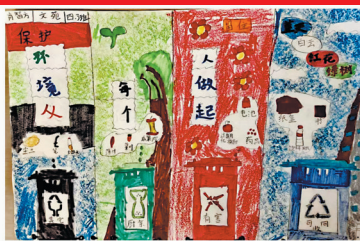
保护环境,从每个人做起 牡丹区文苑学校四·三班 肖智方(小记者编号:039191)作