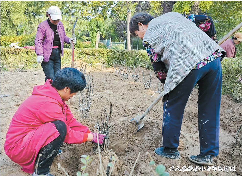
工人在进行牡丹芍药种植

本报讯(牡丹晚报全媒体记者 姜培军) 10月26日,记者从曹州牡丹园获悉,为让园内牡丹花海更壮观,增强其观赏性、历史感、传承性,该园将打造游园观花新亮点,新增传统四大名品观赏区、四大种群观赏区、赛花会获奖作品展示区和历史传承展示区。