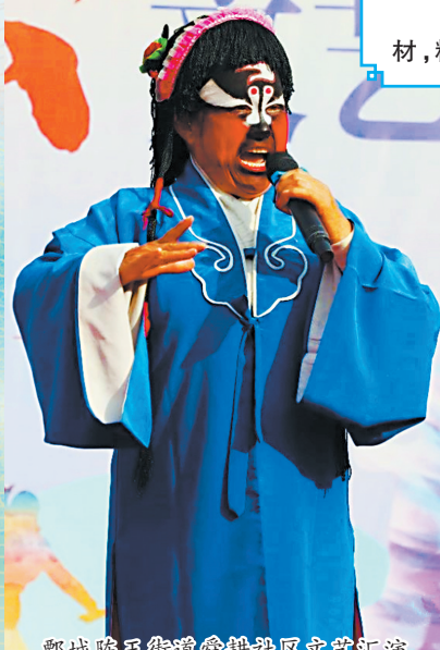
鄄城陈王街道舜耕社区文艺汇演

山东省2024年度小戏小剧优秀剧目展演活动于12月16日至17日在菏泽拉开序幕，是有原因的。