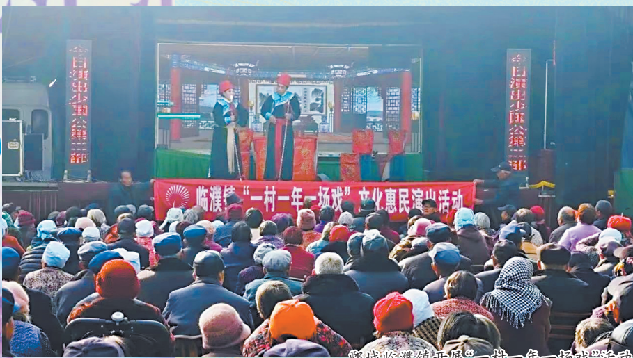
鄄城临濮镇开展“一村一年一场戏”活动