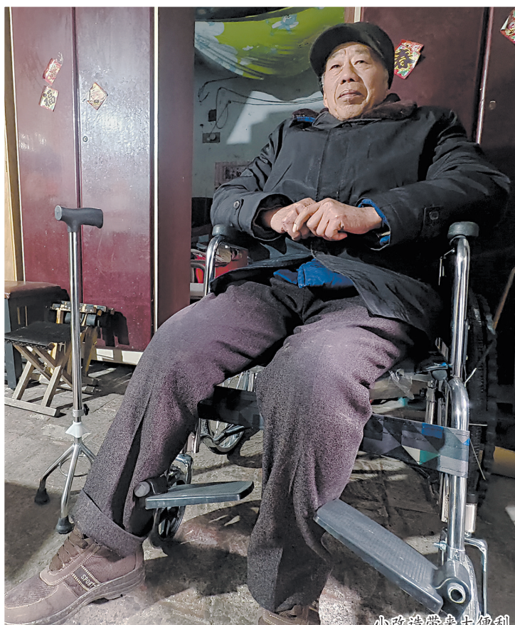
小改造带来大便利