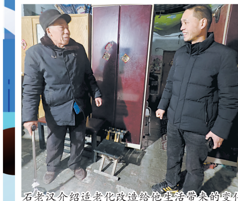
石老汉介绍适老化改造给他生活带来的变化