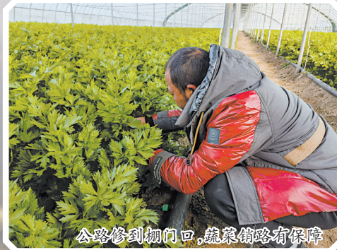
公路修到棚门口,蔬菜销路有保障