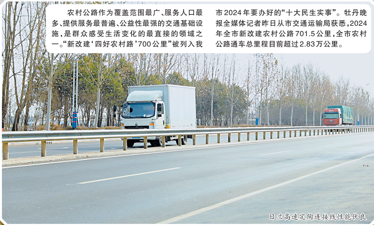
日兰高速定陶连接线性能优良

市2024年要办好的“十大民生实事”。牡丹晚报全媒体记者昨日从市交通运输局获悉,2024年全市新改建农村公路701.5公里,全市农村公路通车总里程目前超过2.83万公里。