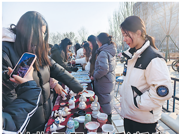
创艺无限,赋彩新春

此次我市推出的“便民找药”服务,对医保定点零售药店信息进行了大数据梳理,实现了“全城搜药,一键比价”,能助力群众快速定位药店,方便群众购药。目前,“便民找药”已覆盖全市997家门诊统筹定点药店和192家定点民营医疗机构,分别公开9013种和9434种医保药品,市民只需轻点手机屏幕就能轻松实现“价比三家”,购买到性价比最高的药品。不仅如此,“便民找药”功能还有助于医保基金的有效监管和市场公平竞争,实现了医保目录药品“方便查、高效比、精准管、便捷购”的医保服务体验,提高了医保目录药品综合管理效能。