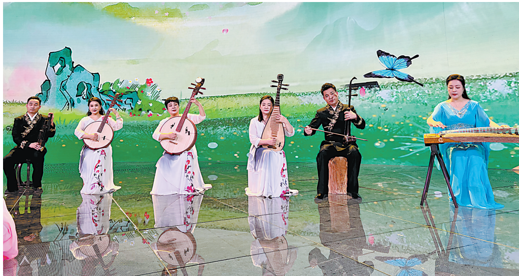
山东古筝乐和菏泽弦索乐亮相2025年非遗晚会。

■文化和旅游部与中央广播电视总台联合摄制的《非遗里的中国》新春特别节目——《2025年非遗晚会》春节期间在CCTV-1(央视综合频道)播出。在这场对非遗传承人而言相当于“非遗春晚”的节目中,我市山东古筝乐和菏泽弦索乐两个国家级非遗代表性项目分别亮相。节目保密期结束后,牡丹晚报全媒体记者采访了我市参与录制的非遗传承人,了解了晚会幕后的故事。