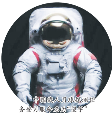
中国载人月球探测任务登月服命名为“望宇”

社会引起广泛关注和热情参与,共收到来自航天、科技、文化传播等领域的组织机构与社会各界人士的9000余份投