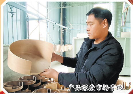
产品深受市场青睐

汽车线束的投资研发,进一步增强企业市场竞争力,提高经济效益和社会效益,为我市经济高质量发展做出新的更大贡献。”华国信表示。