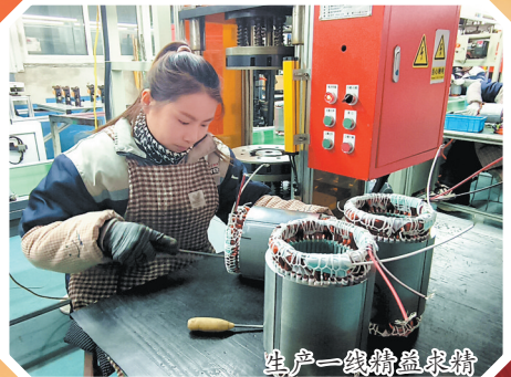
生产一线精益求精

现在,菏泽高烽电机的产品不仅销往全国,还进军欧洲、北美、南美等市场,产品远销东南亚、西亚、非洲、欧美等国家。