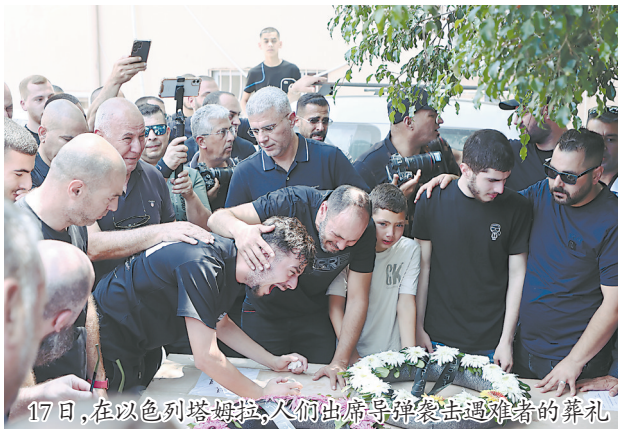
17日,在以色列塔姆拉,人们出席导弹袭击遇难者的葬礼

当前双方的冲突仍呈现出继续升级的趋势。就在此时,美国方面传出消息,第三艘美国航母即将部署至以色列附近。美国总统特朗普更是发表了一系列对伊强硬表态。