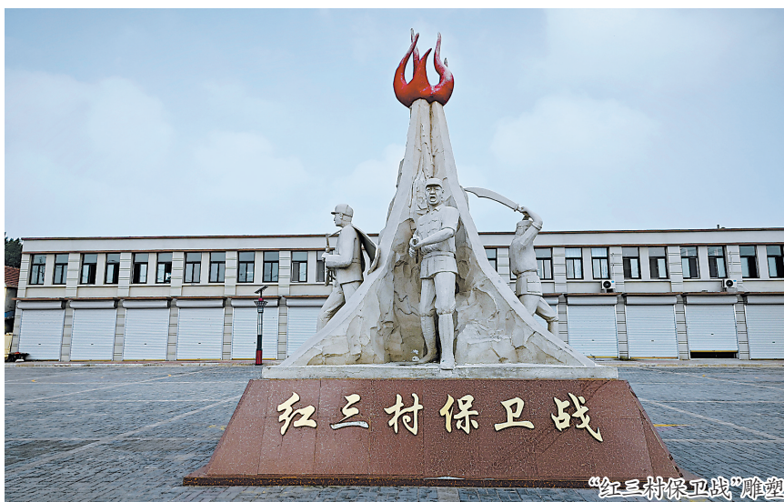
“红三村保卫战”雕塑

1938年10月,日军侵占曹县城,中共曹县县委从县城迁至刘岗村。1939年7月,