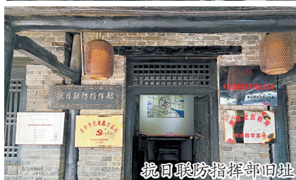
抗日联防指挥部旧址