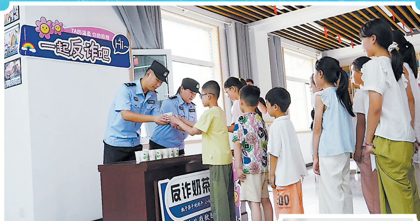
成武警方通过“反诈奶茶”向小朋友宣传反诈知识

近期,菏泽各级公安机关针对电信诈骗“暑期档”,通过揭秘诈骗手段、解析真实案例等多种途径,积极宣传暑期反诈知识。