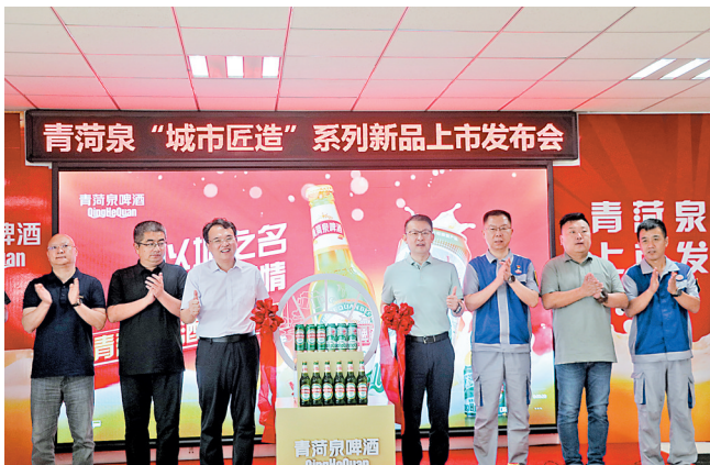
青荷泉“城市匠造”系列新品发布会现场。

青荷泉品牌的焕新回归,既是承载菏泽时代印记与集体青春记忆的“岁月名片”,也是菏泽城市发展进程中一个温暖而闪亮的注脚。