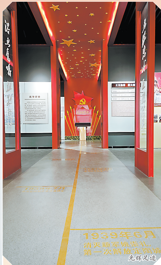
1939年6月 消灭顽军姚崇礼， 第一次解放定陶城 光辉足迹