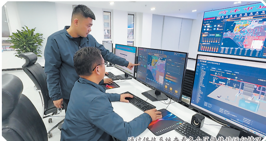
通过供热系统查看各小区换热站运行情况