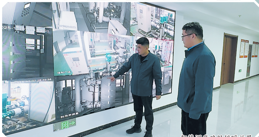
智慧调度确保供暖效果

据了解,该公司自9月2日起对辖区410个换热站进行二级管网注水打压,10月底全部完成;城区主管网10月15日开始注水,10月30日启动升压及冷循环,11月8日进入热态循环。为保障今冬供暖效果,公司自4月底实施“冬病夏治”计划,针对上一供暖季突出问题建立整改台账,完成一二网维修改造项目322项,维修更换入户阀门28846个、一二网焊接阀门769个、杠杆式放气阀2851个;更换低效换热器7台、高耗能水泵29台;为181座换热站制定“一站一策”消缺方案,更换老旧补偿器810个;针对15个老旧小区管网布局不合理、换热站负荷不足等问题,制定“一区一策”节能改造方案,目前已全部完工。