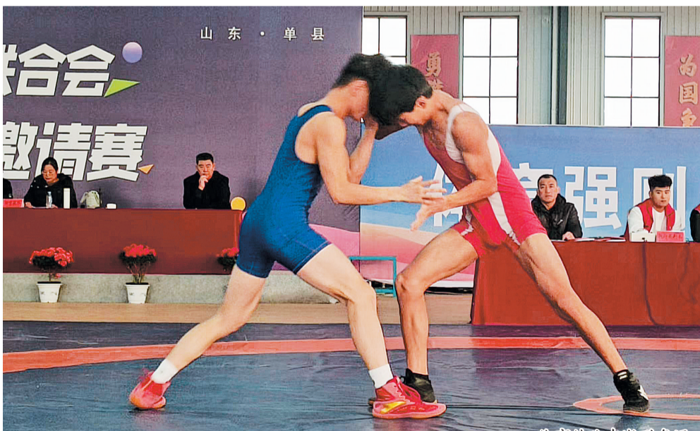
体育健儿在激烈角逐

本报讯(通讯员 刘波) 2025年全国青少年体育联合会古典式摔跤邀请赛近日在单县冠县体育馆开赛,吸引了全国各体校、学校、武校、俱乐部等23支代表队的426名青少年摔跤选手参赛。