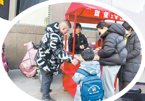
制作的蛋糕、面包受欢迎